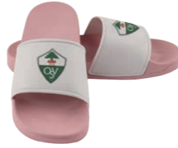
rosa mit weißer Lasche