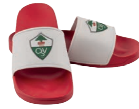
rot mit weißer Lasche