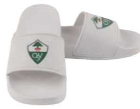
weiß mit weißer Lasche