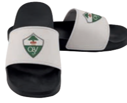
schwarz mit weißer Lasche