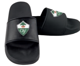
schwarz mit schwarzer Lasche