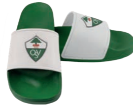
grün mit weißer Lasche